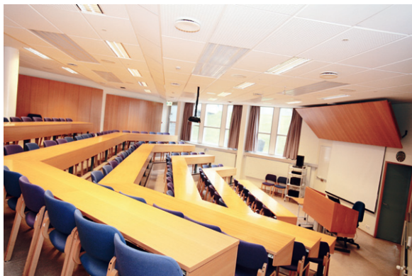
Náma, 90 manna kennslusalur á neðri hæð