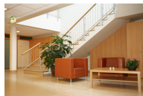
Setustofa á neðri hæð