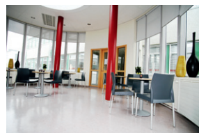
Setustofa á efri hæð