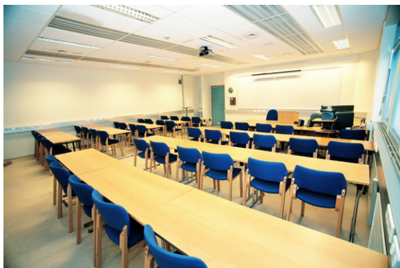
Elding, ein af fjórum 40 manna stofum